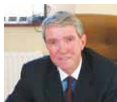
An tUasal Eddie Breen, Bainisteoir Contae, Comhairle Contae Loch Garman