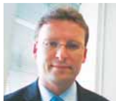
An tUasal Enda Holland, Príomhoifigeach Cúnta, an Roinn Airgeadais